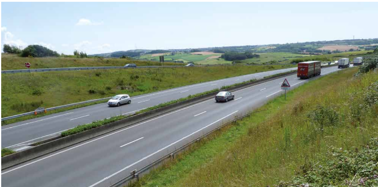
Le simulateur compare les impacts de différentes stratégies d'aménagement (ici, autoroute A16 dans le Pas-de-Calais).